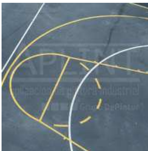
Propuesta: Marcaje de pistas multideportivas con calles de atletismo