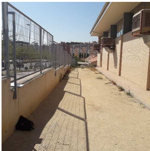
Estado actual: Fachada este

Los juegos a dibujar en el suelo se consensuarán con los colegios.