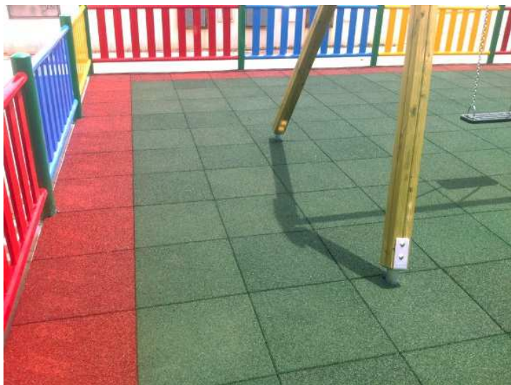
Estado reformado: Suelo blando con elementos de psicomotricidad