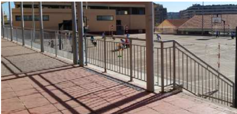
Propuesta: Colocación de asientos